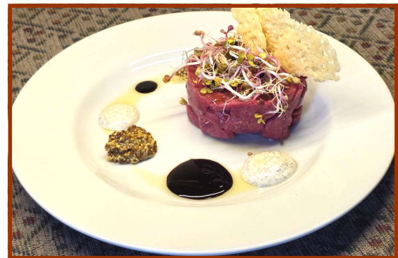
Tartare del Gran Ducato