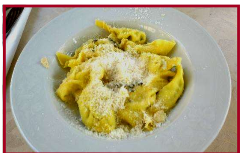
I tortelli con burro e salvia