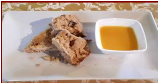
La Sbrisolona di Grazzano