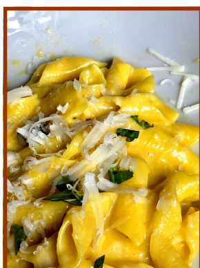
Garganelli Oro Emilia