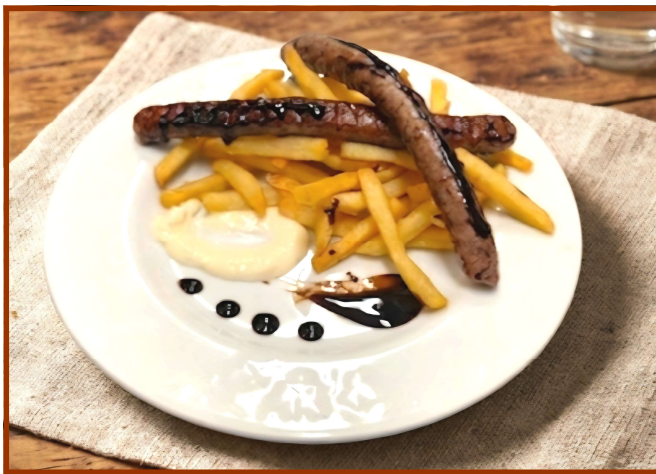
La Salsiccia BBQ