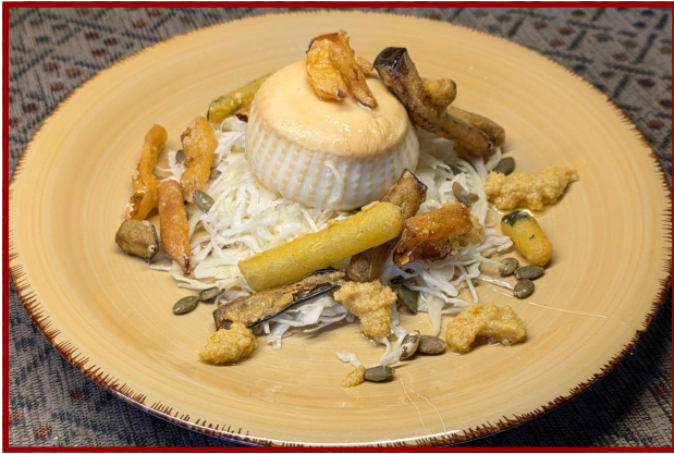
Burratina oltre il Po