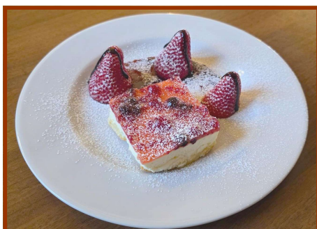
Semifreddo del sottobosco