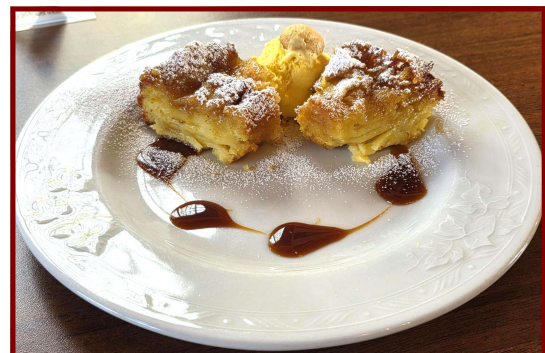
La torta di mele "Bruna"