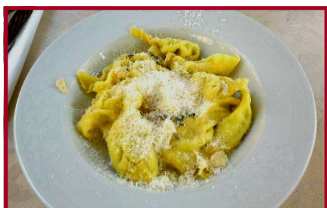
I tortelli con burro e salvia