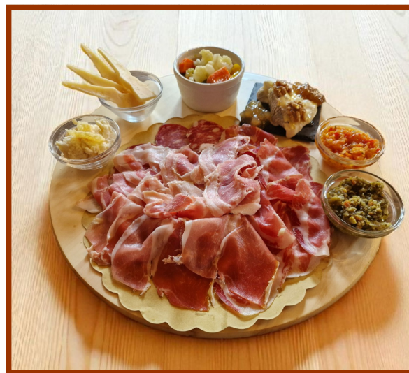
Il Gran Tagliere della Taverna