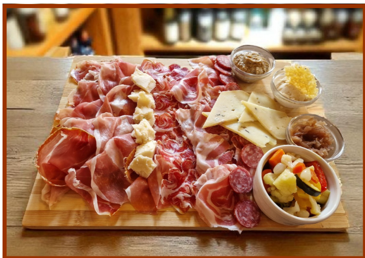
Il Gran Tagliere Emilia