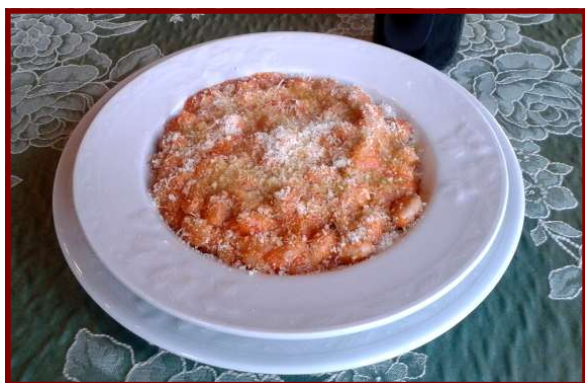
I risarei e fasò