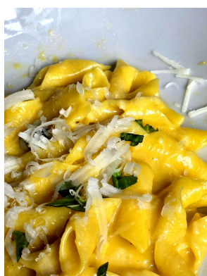
Garganelli Oro Emilia