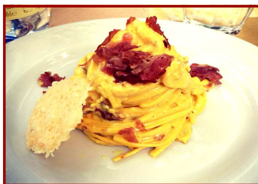
I tagliolini alla carbonara di culatello