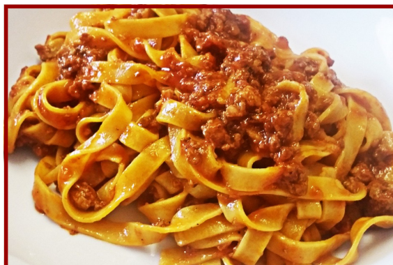
Le tagliatelle al ragù