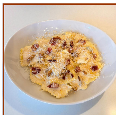
Tortelli di zucca