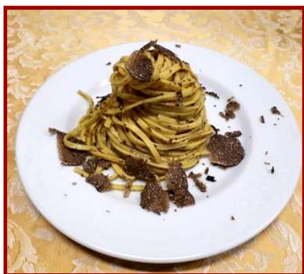
I tagliolini al tartufo