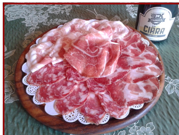
Il tagliere di salumi misti DOP